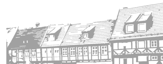
Foto: "Hansestadt Salzwedel" - Torsten Maue, nach CC BY 4.0, zugeschnitten und nachgezeichnet

Stadtpaziergang durch die mittelalterliche Innenstadt mit Burggarten und Burgturm und Besichtigung der Mönchskirche